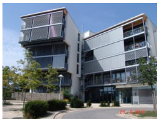
3.4 Herrenberg: Mehrgenerationenwohnprojekt „Haus Weitblick“