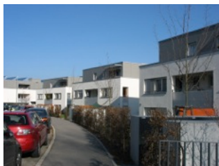
3.1 Esslingen: „MehrGenerationenWohnen“ Zollberg

Die Angaben zu Bewohneralter, Haushaltsmischung und Wohnungsgrößen waren in den Projekten nicht einheitlich abrufbar, daher werden sie in den Steckbriefen unterschiedlich dargestellt.