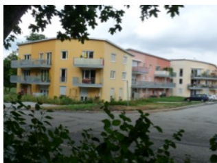
3.3 Schwäbisch Hall: Mehrgenerationenprojekt „Heller Wohnen“