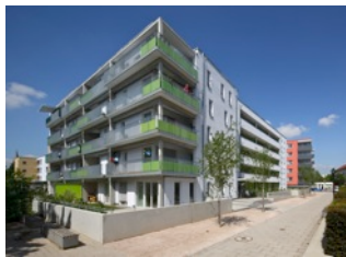
3.2 Ulm: Mehrgenerationenwohnen Ulm-Weststadt